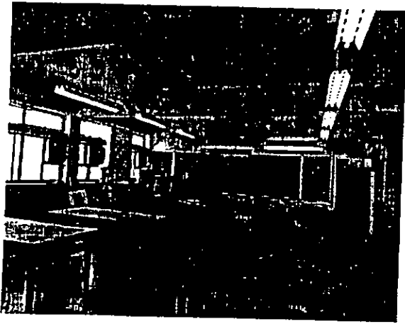
原本的課室將會成為遠程教室

培育兒童及青少年有正確的價值觀和積極的人生觀，並以校訓「勤、儉、忠、信」為進德修業的依歸，勉勵他們拓展豐盛而有意義的人生。