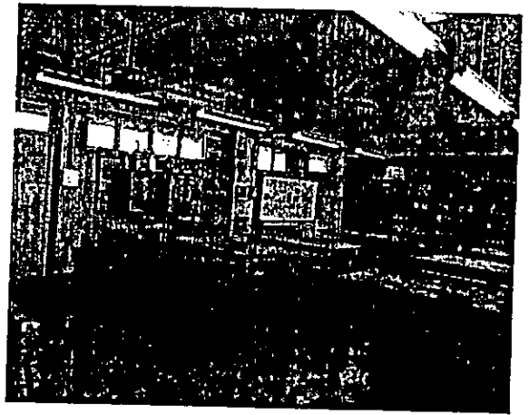
原本課室的另一側