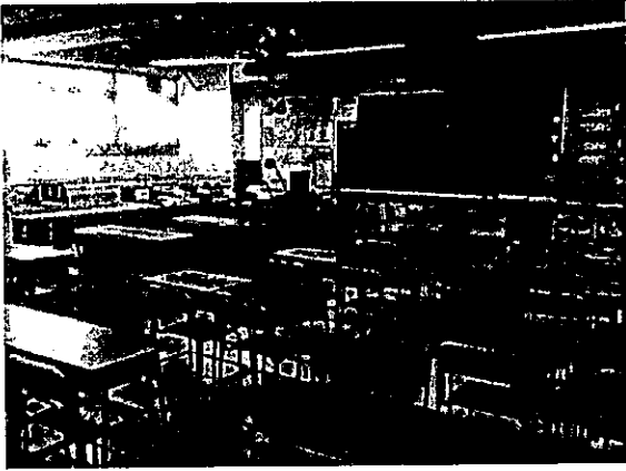
原本的課室將會成為遠程教室

我們學校的組織及文化是應由校內各成員共同發展、共同擁有，因而共同承擔，從而達到本校的教育目標。