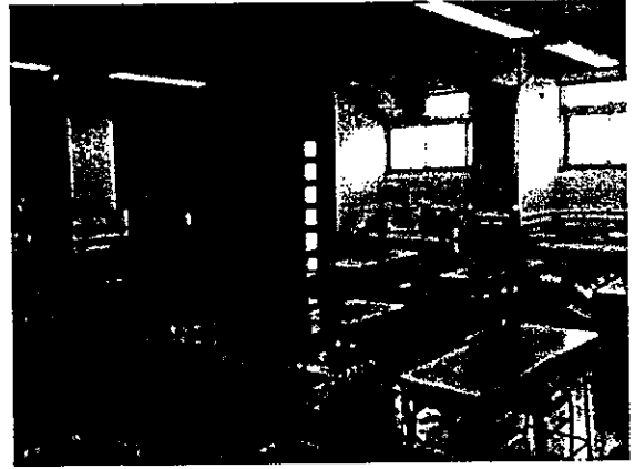
原本課室的另一側