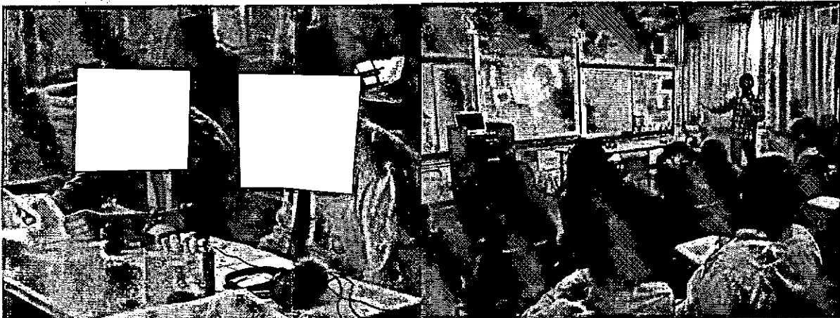
學生生命教育活動體驗—配音工作坊