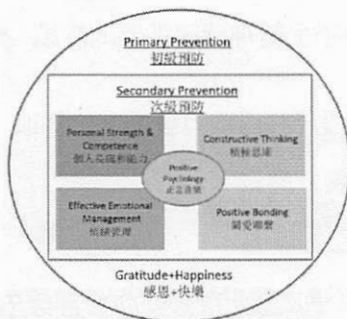
「尊重生命、逆境同行」 (2017 - 2018)