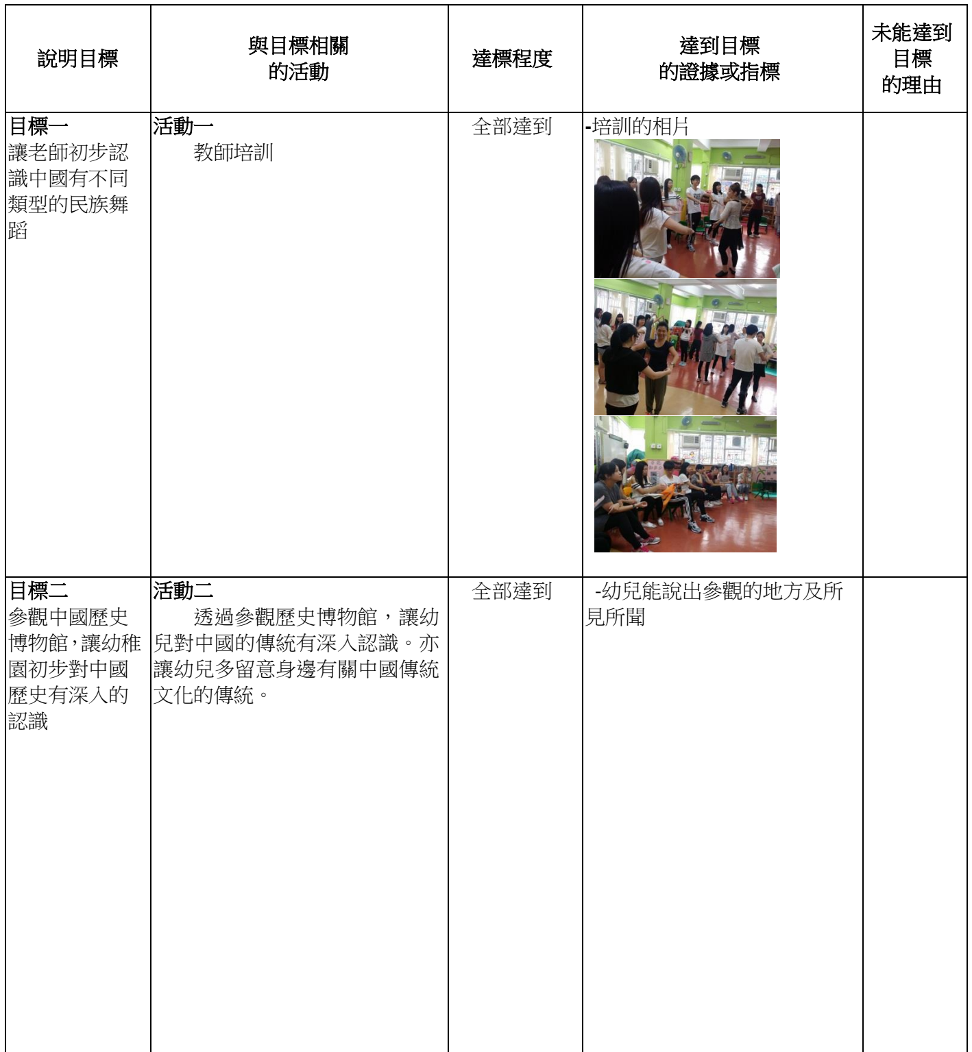
表一：目標是否達到

評鑑是否已達致計劃書內列明的各項目標時，須包括以下項目(有關資料可按本附件內表一的格式，或以簡短段落形式書寫)：