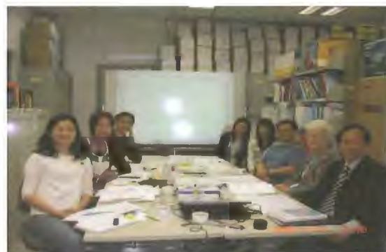
姬絲蒂教授與教師討論通識教育科語體

在功能語法理論指導下，我們分析了 2007 至 2009 年高級補充程度的通識教育科的考題，並參考今年本科文憑試的練習題和考試題作論證。語體分析初步結果顯示，通識教育科常見的語體包括描述語體 (Description)、解說語體 (Explanation) (這又可細分為因素解說 (Factorial Explanation)、後果解說 (Consequential Explanation) 及原因解說 (Causal Explanation))、建議語體 (Recommendation)、比較語體 (Comparison)、論說語體 (Exposition) 和評議語體 (Discussion)。